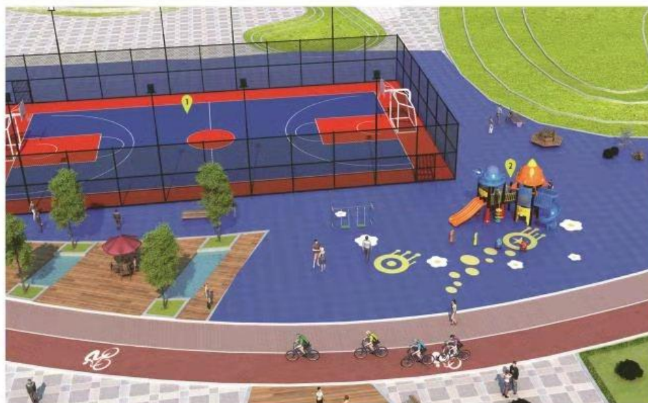
山西省社区全民健身中心 (室内+室外)