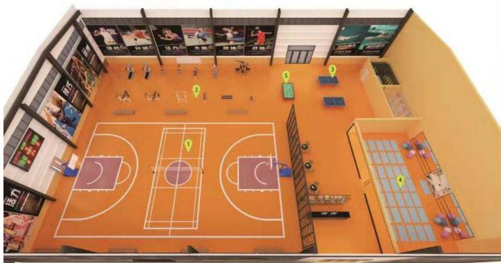
山西省社区全民健身中心 (室内)