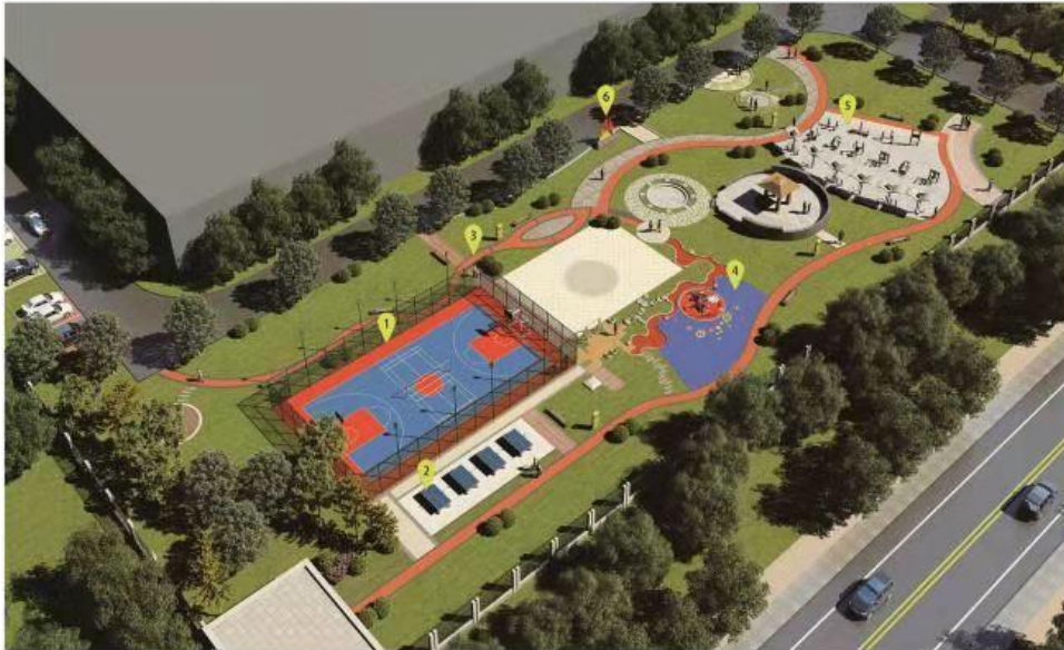
山西省社区全民健身中心 (室外)