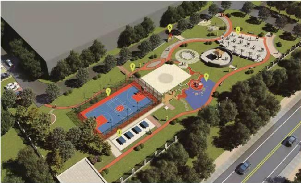
山西省社区全民健身中心（室外）