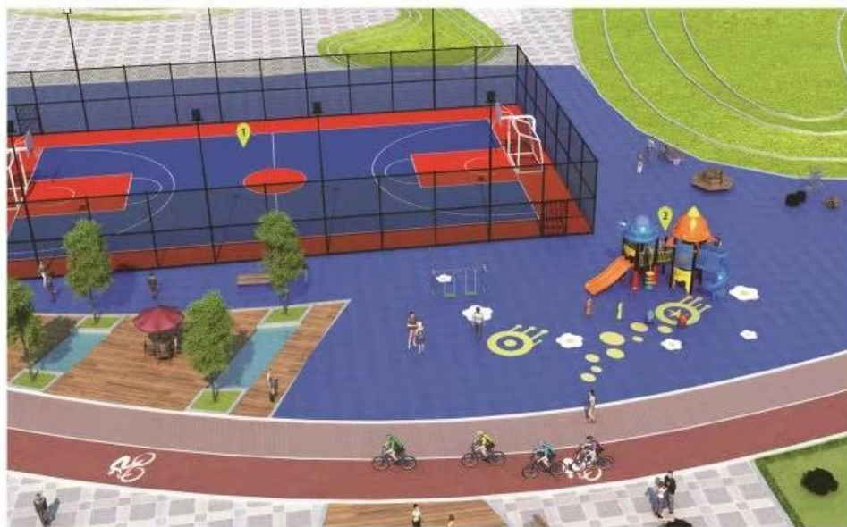
山西省社区全民健身中心（室内+室外）