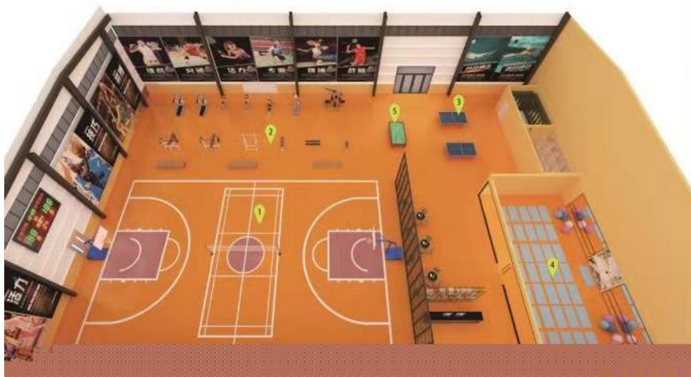
山西省社区全民健身中心（室内）